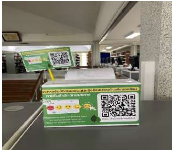
แบบฟอร์มรับข้อเสนอแนะและข้อร้องเรียนด้านสิ่งแวดล้อมสำนักวิทยบริการ