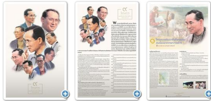
ภาพที่ 3 นิทรรศการออนไลน์

2. ในการจัดประชุมจะมีการจัดอาหารว่าง และเครื่องดื่มเป็นมิตรกับสิ่งแวดล้อม โดยเลือกใช้กล่องกระดาษชานอ้อย เลือกใช้แก้วน้ำ และภาชนะที่สามารถล้างแล้วนำกลับมาใช้ใหม่ได้