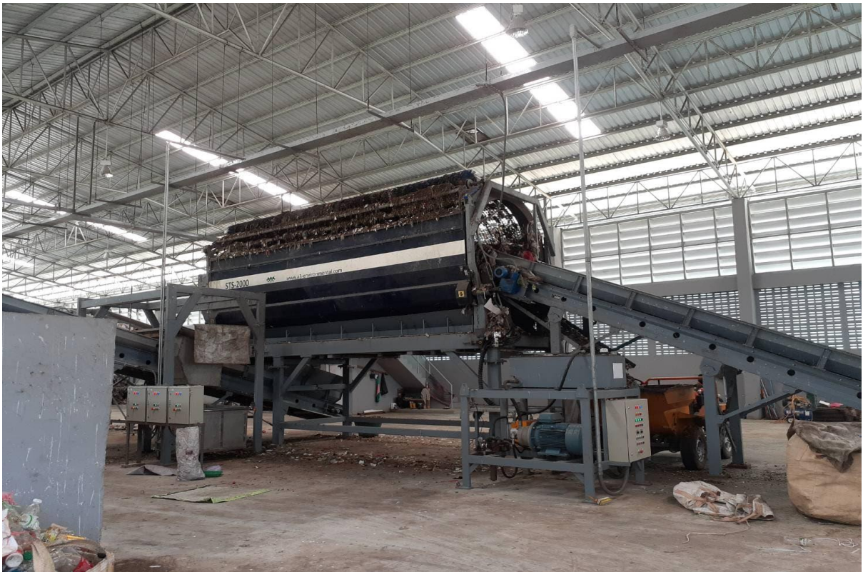
ผ่านเข้าเครื่องเพื่อคัดแยกขยะ