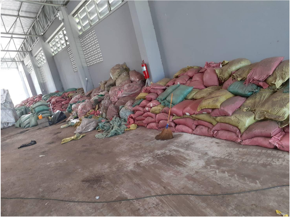
ปุ๋ยที่ผ่านการผลิตแล้วบรรจุในกระสอบเพื่อรอจำหน่าย