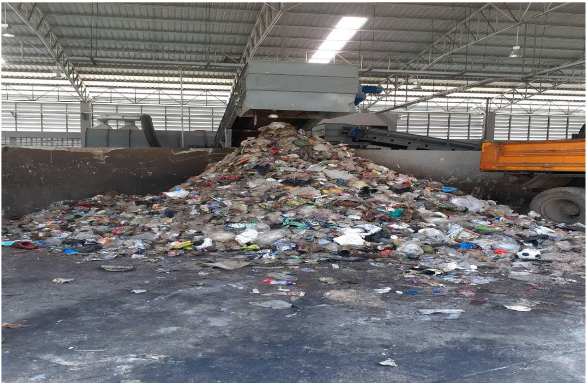
ขยะที่เป็นพลาสติกที่ผ่านการคัดแยก