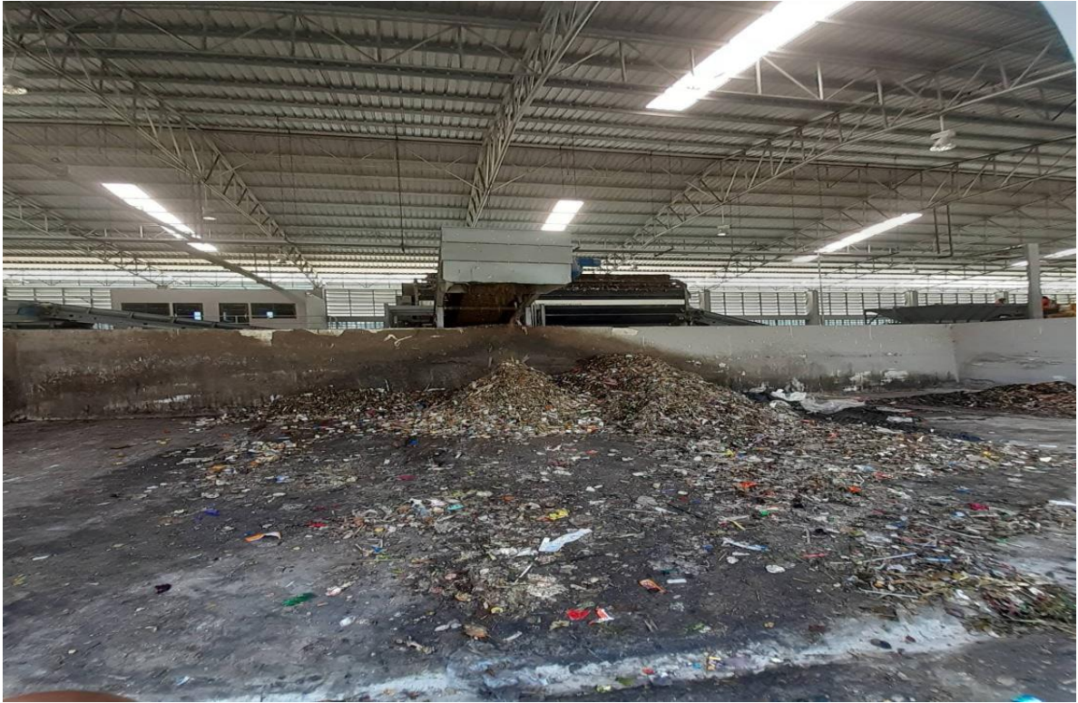
ขยะที่ผ่านการคัดแยกแล้วเพื่อจะนำมาทำปุ๋ย