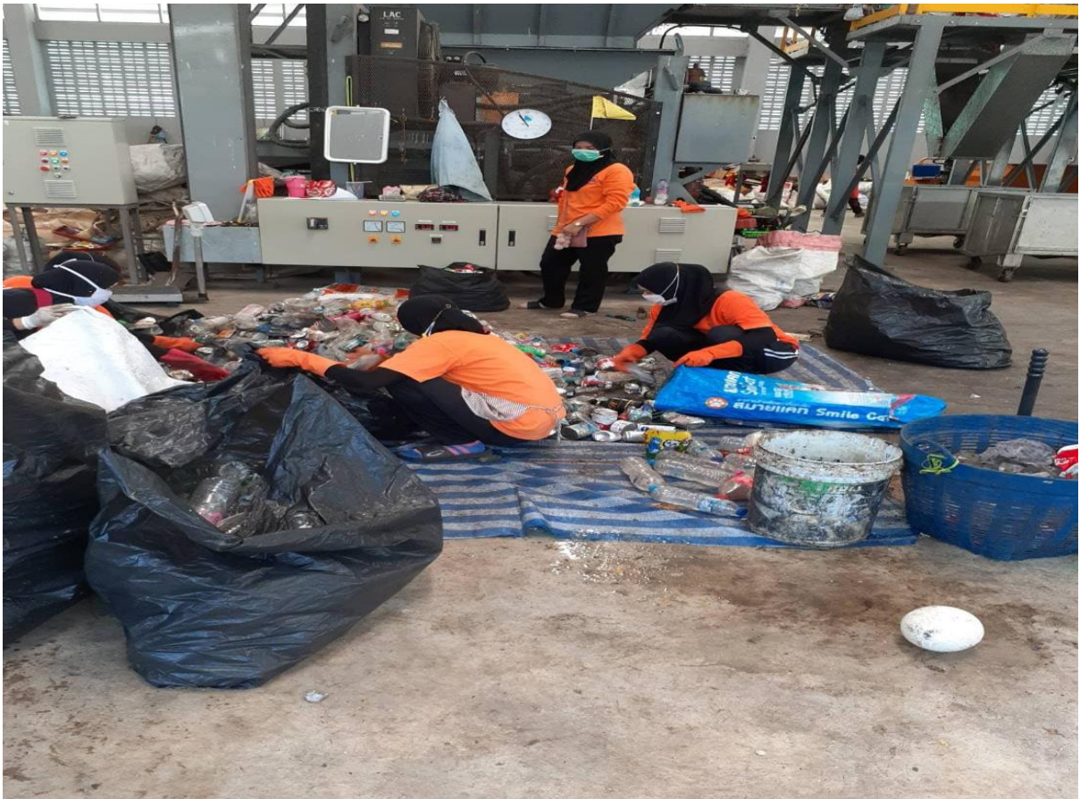
พนักงานคัดแยกขยะรีไซเคิล