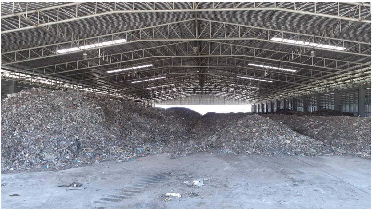
โรงเรือนพักขยะเพื่อรอทำปุ๋ย