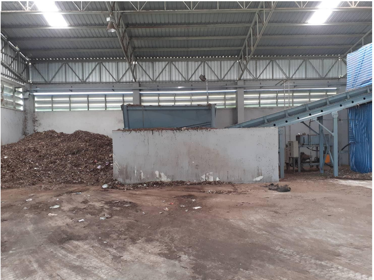
โรงเรือนผลิตปุ๋ย