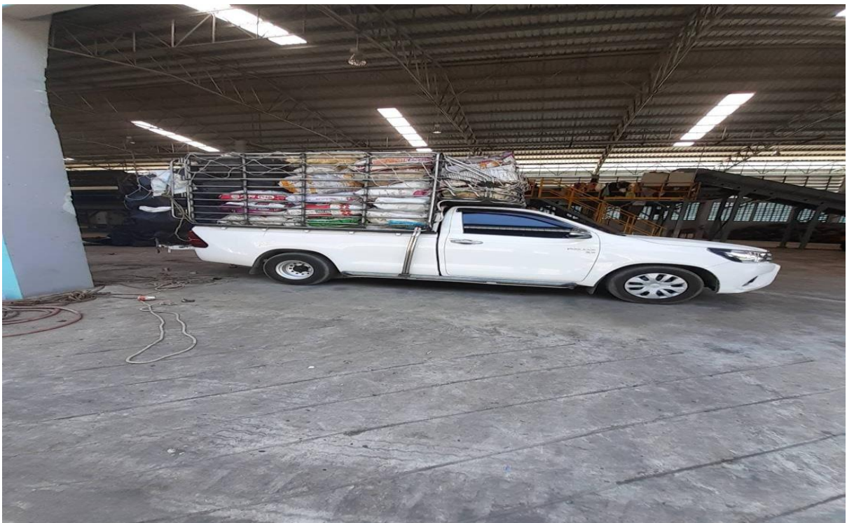
พ่อค้ามารับ- ซื้อขยะรีไซเคิล