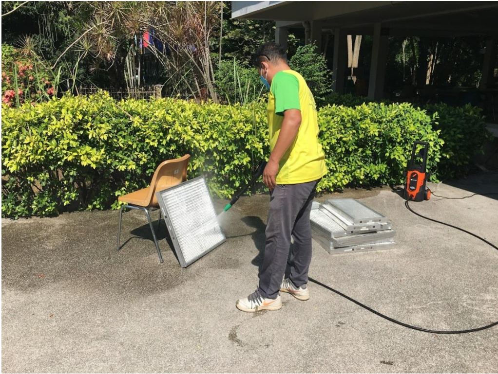
ภาพที่ 1 แสดงการล้างแผงกรองอากาศ