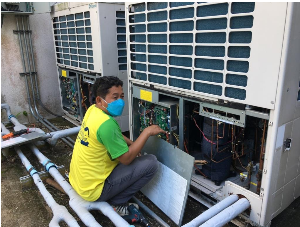
ภาพที่ 2 แสดงการตรวจเช็คระบบไฟฟ้าคอนเดนซิ่งยูนิต