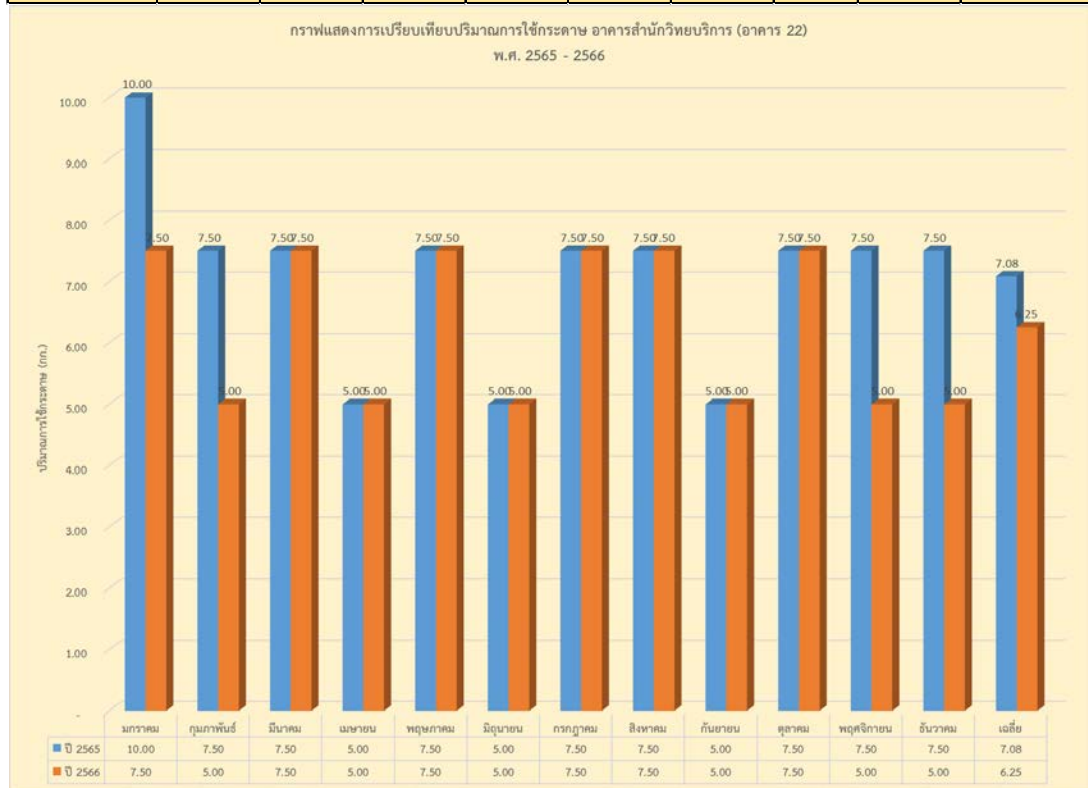
ภาพที่ 1 กราฟแสดงการเปรียบเทียบปริมาณการใช้กระดาษ อาคารสำนักวิทยบริการ (อาคาร 22) เดือนมกราคม - ธันวาคม พ.ศ. 2565 - 2566